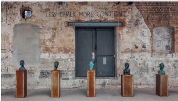
Kreative Werkstatt Lobetal | Bronzeskulpturen