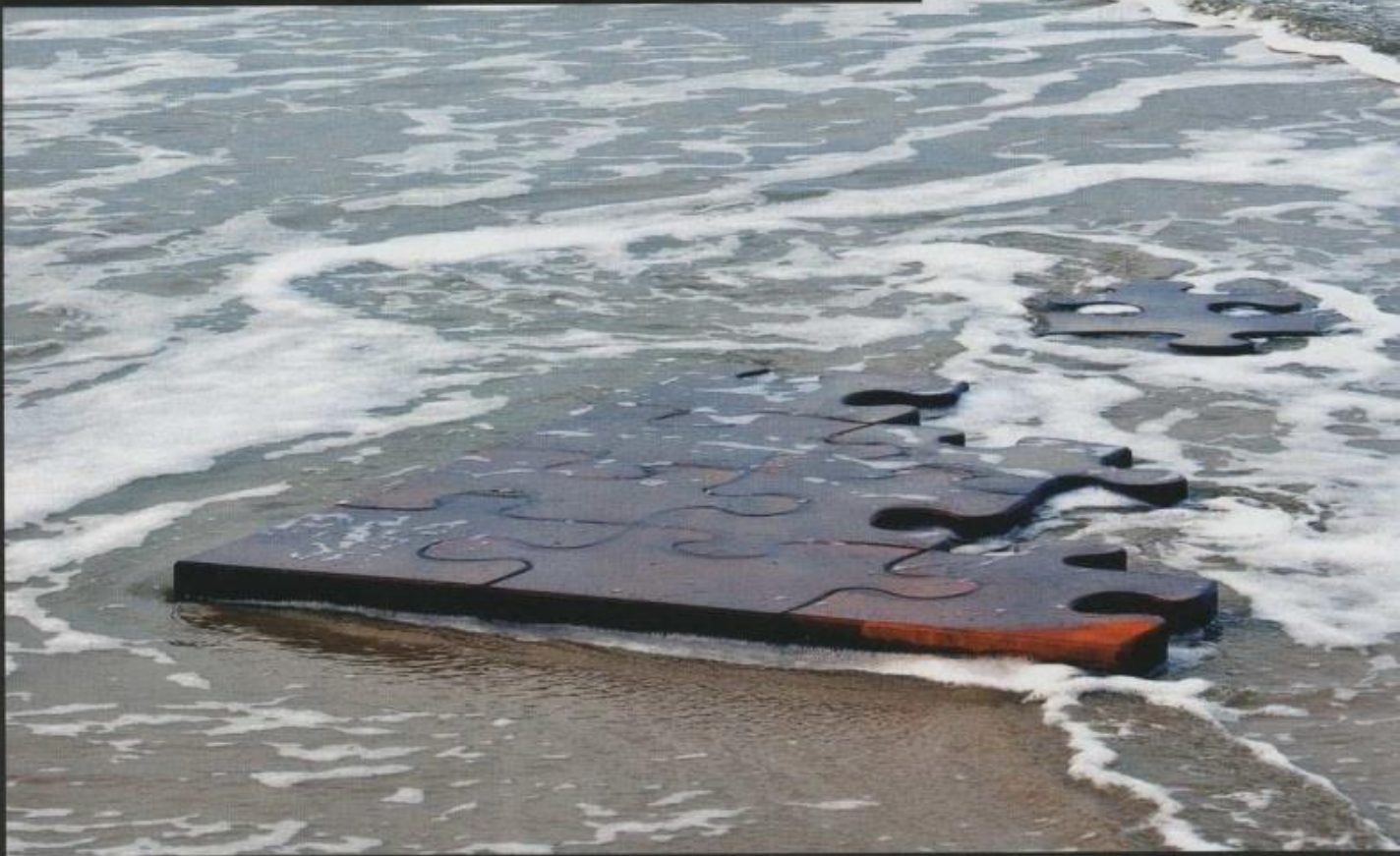
SEHNSUCHT Acht Zentimeter dicke, korrodierte Stahlplatten am Sylter Flutsaum. Jedes Puzzleteil wiegt 152 Kilogramm.